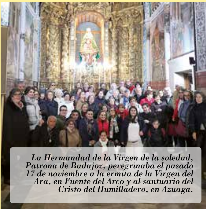
La Hermandad de la Virgen de la soledad, Patrona de Badajoz, peregrinaba el pasado 17 de noviembre a la ermita de la Virgen del Ara, en Fuente del Arco y al santuario del Cristo del Humilladero, en Azuaga.