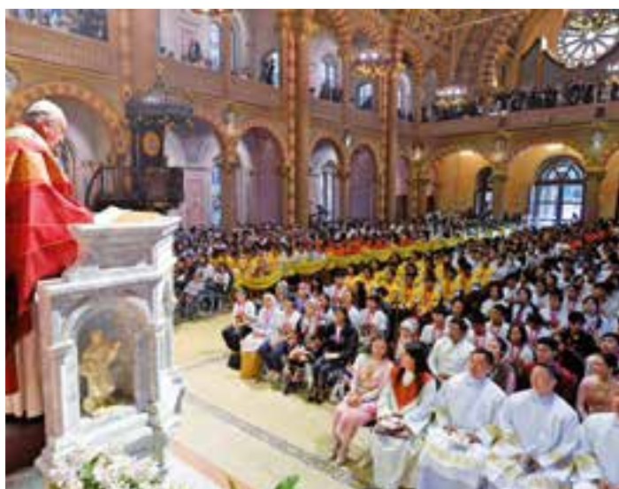
EL papa Francisco presidió la Eucaristía en la Catedral de Bangkok (Tailandia).

En Japón, el leitmotiv de la visita fue la paz. El lema elegido en ese viaje era “Proteger toda vida” y destacan las reuniones con los supervivientes de la bomba atómica en Hiroshima y Nagasaki y el triple desastre de 2011: terremoto, tsunami y accidente nuclear en Fukushima. Las palabras del Papa fueron