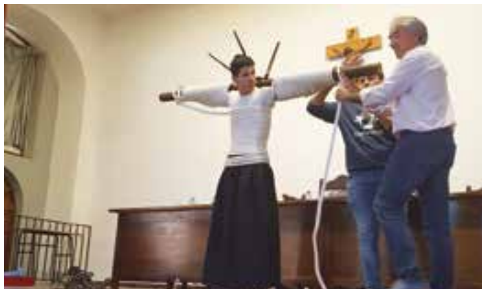
Uno de los talleres mostró la preparación de empalao.