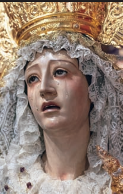
Nuestra Señora del Mayor Dolor

F. Díaz Jiménez y A. Castillo Ariza / 1945