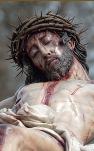
Stmo. Cristo de la Piedad