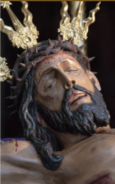
Stmo. Cristo de la Misericordia

1937. Fusionada con la del Santísimo Sacramento (1534) y con la de los Santos Mártires (1773)