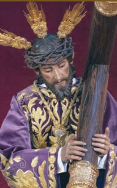
Ntro. Padre Jesús de la Pasión