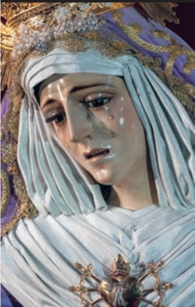
Ntra. Sra. de las Lágrimas en su Desamparo