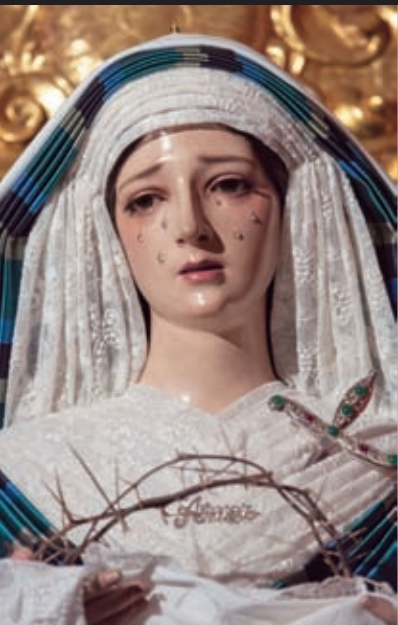
María Stma. del Amor