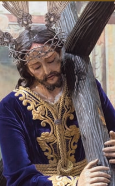
Ntro. Padre Jesús del Calvario