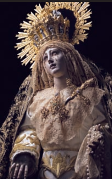
María Stma. Nazarena