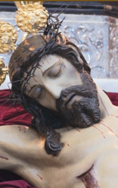
Señor de la Caridad Anónimo / Siglo XVI