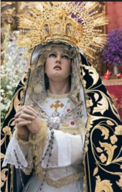
María Stma. de los Dolores y Misericordia Atribuida a Venancio Marco Roig / Siglo XIX