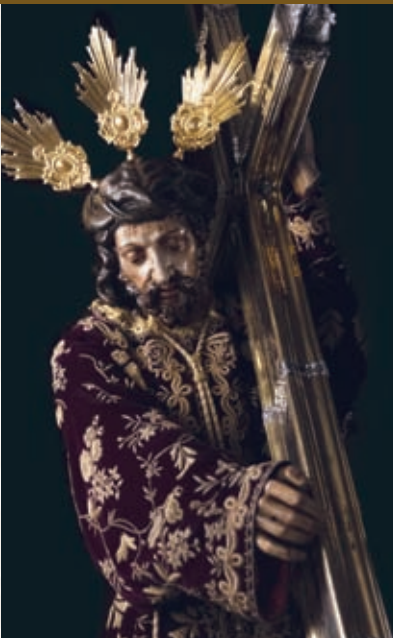
Ntro. Padre Jesús Nazareno