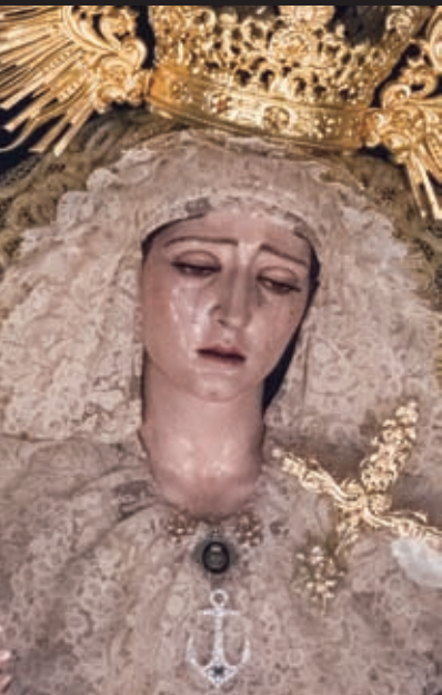
Mª. Stma. de la Esperanza del Valle