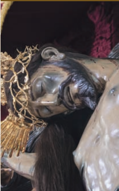
Santísimo Cristo de Gracia Anónimo / Siglo XVII