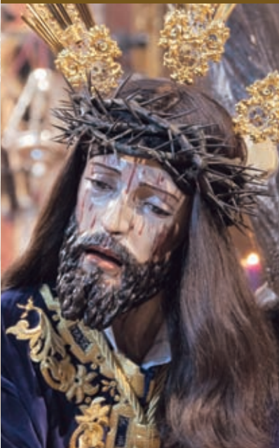
Ntro. Padre Jesús Caído