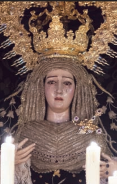
Ntra. Sra. del Mayor Dolor en su Soledad