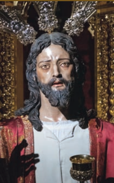
Ntro. Padre Jesús de la Fe