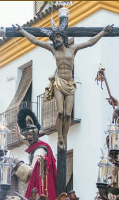
Stmo. Cristo de la Agonía Antonio Castillo Ariza / 1956