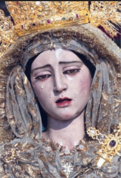
Ntra. Señora de la Salud Miguel Ángel González Jurado / 1988