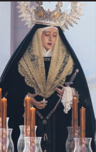
Nuestra Señora de la Presentación