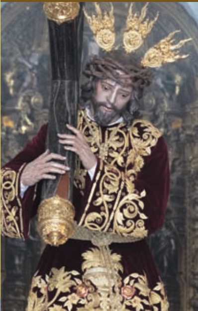
Ntro. Padre Jesús del Buen Suceso Anónimo / Siglo XVII