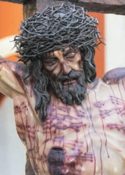
Stmo. Cristo de la Universidad