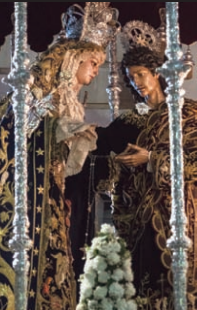
Ntra. Sra. Reina de los Ángeles Luis Álvarez Duarte / 1980