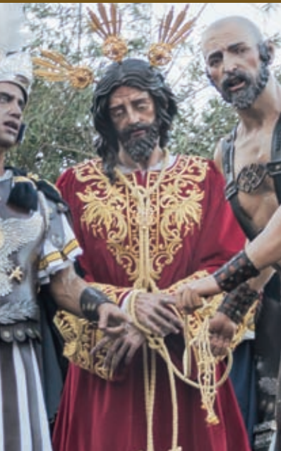
Ntro. P. Jesús en su Prendimiento Antonio Dubé de Luque / 1990