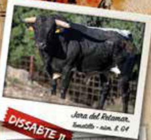
Jora del Retaman, Buenavista - núm. 8, G4