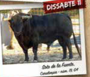
Soto de la Fuente, Castellanos - núm. 19, G4