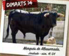
Marqués de Albaserrada, Arredós - núm. 41, G4