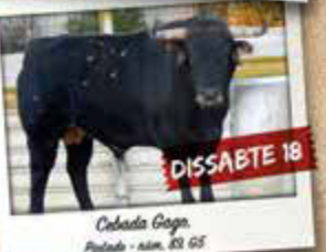
Cebada Gago, Pineda - núm. 83, G5